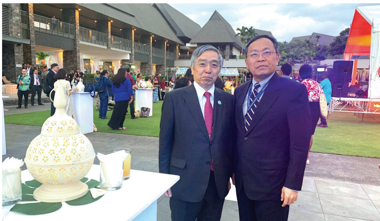
本會呂理事長與日本央行總裁黑田東彥（Mr. Haruhiko Kuroda）於 ADB 年會期間合影

除了 ADB 年會期間相關會議及研討會外，亞銀總裁、主辦國分別於 5 月 2 日及 3 日舉辦晚宴，宴請來自各國的與會代表，並進行交流聯誼。呂理事長在 5 月 2 日亞銀總裁晚會中，與亞銀總裁中尾武彥（Mr. Takehiko Nakao）寒暄致意；5 月 3 日主辦國晚宴上，呂理事長也與日本央行總裁黑田東彥（Mr. Haruhiko Kuroda）寒暄致意。